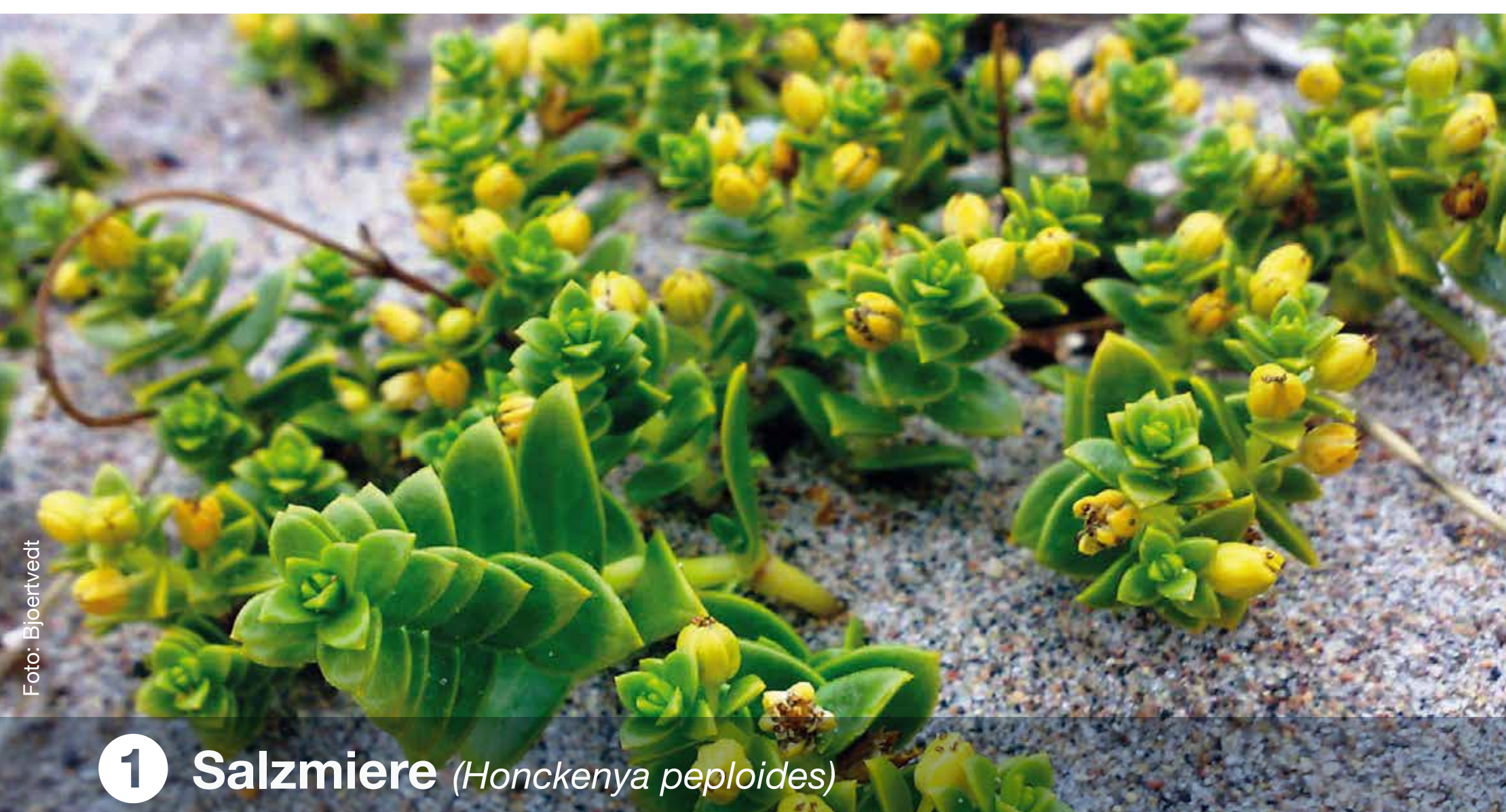
1 Salzmiere ( Honckenya peploides )