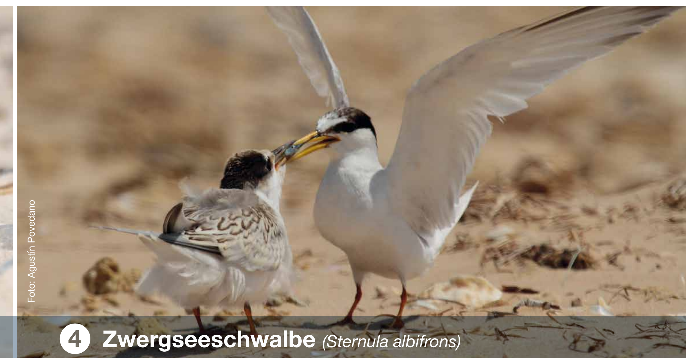
4 Zwergseeschwalbe ( Sternula albinors )

Bewahren Sie mit uns den Palmer Ort in seiner Schönheit.