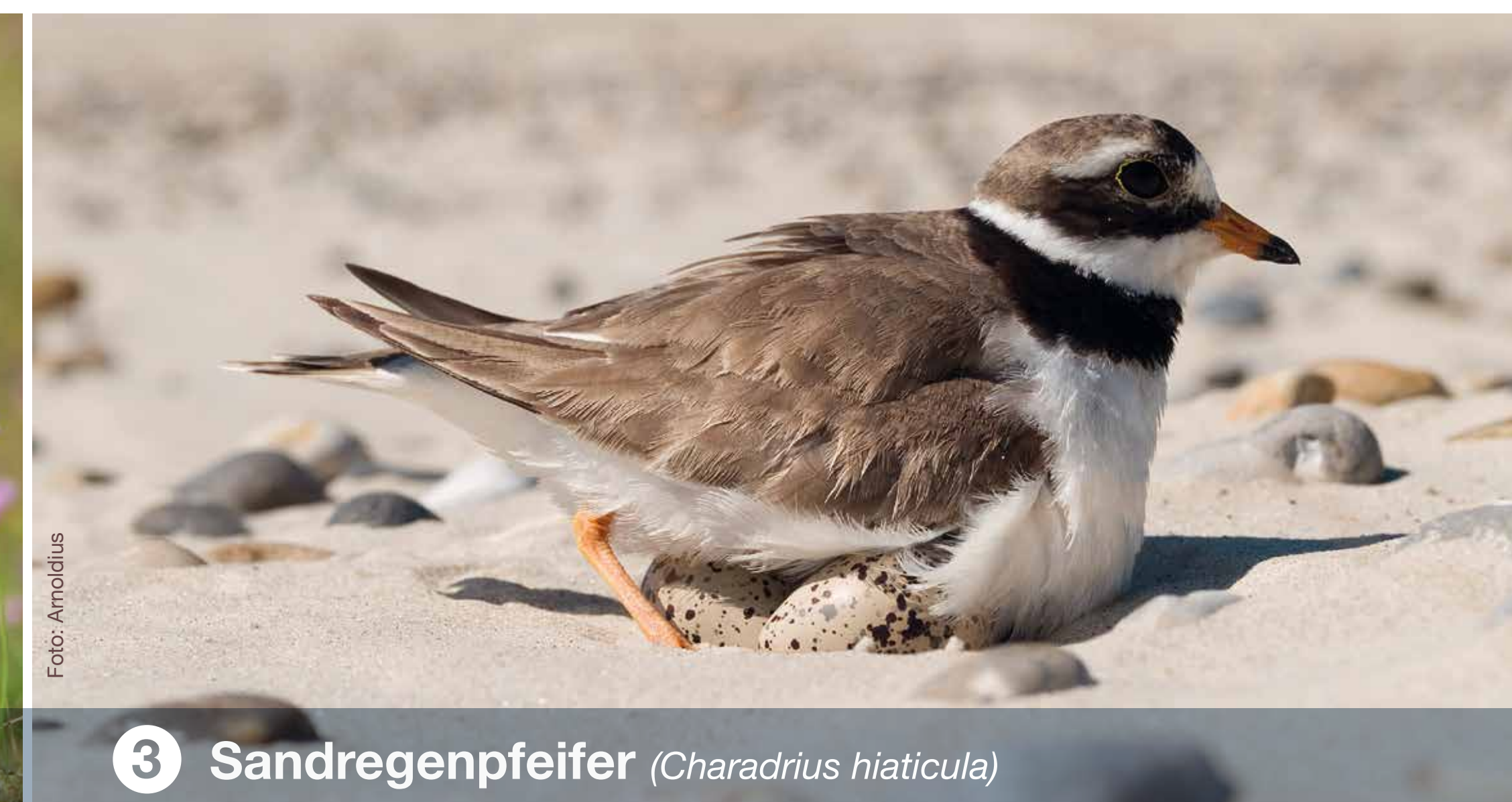
3 Sandregenpfeifer ( Charadrius hiaticula )