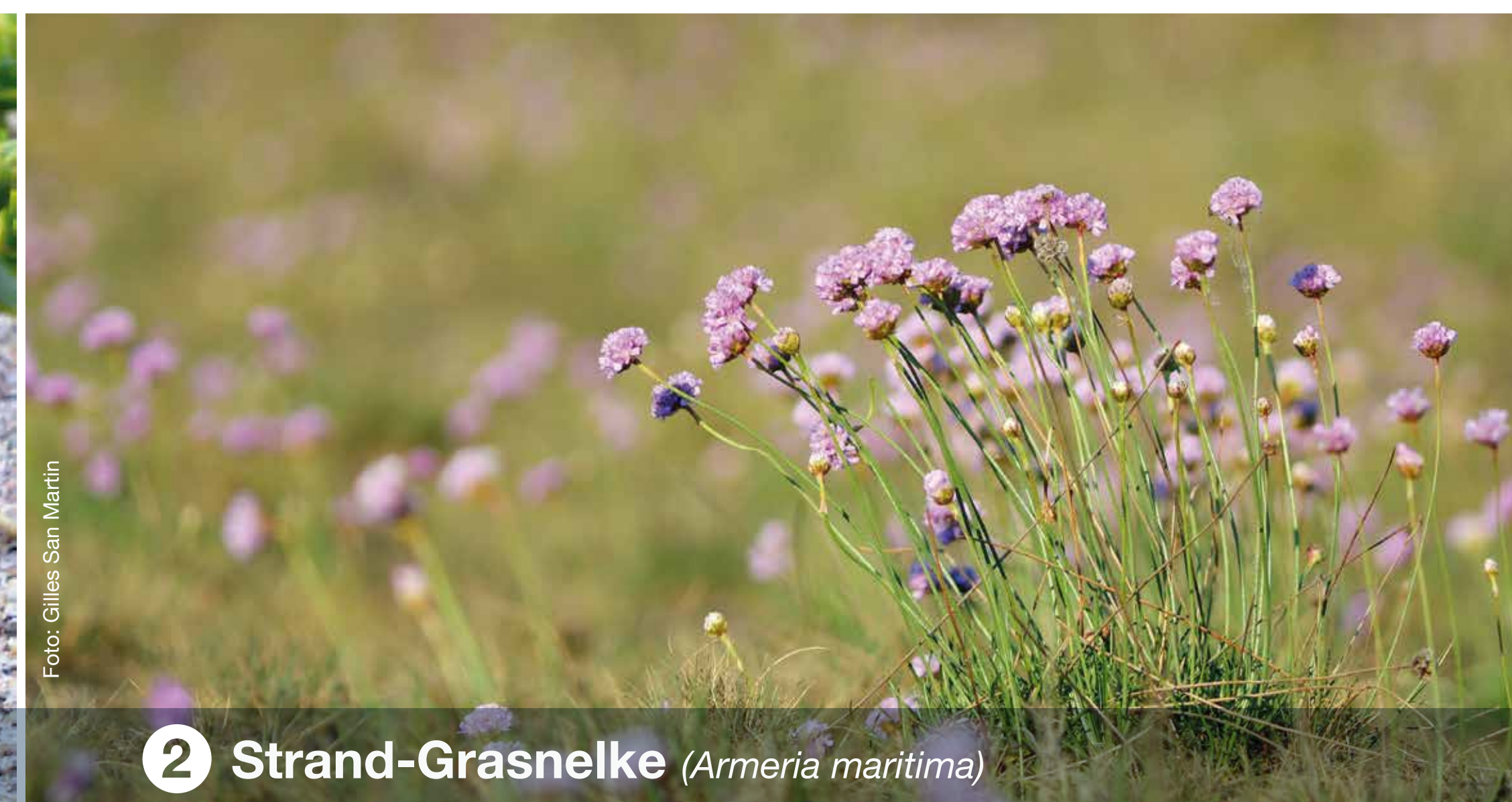
2 Strand-Grasnelke ( Armeria maritima )